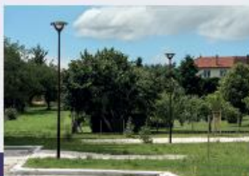
Maintenance et travaux d'éclairage public