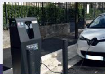
Développement des énergies renouvelables et de la mobilité durable