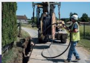
Contrôle et aménagement des réseaux d'électricité et de gaz