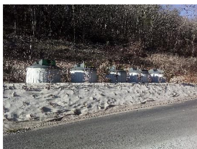
Route des Palombes

Un aménagement paysager a été réalisé par l'entreprise SERRA Paysage sur le site de la Route des Palombes pour un montant de 4 090 € , obligation faite par l'architecte des bâtiments de France.